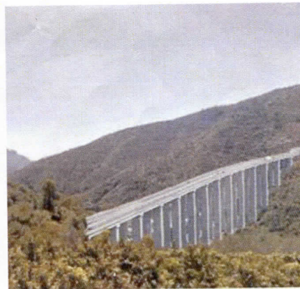
Uno dei viadotti progettati a Giustenice per la bretella autostradale